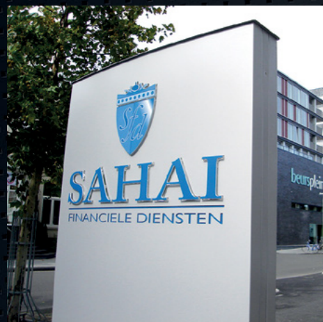
ZUIL MET VERLICHTE DOORSTEEK LETTERS